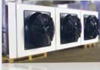
Oda Soğutucuları Unit Air Coolers