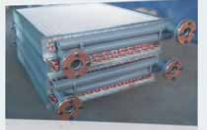
Klima Kondenser ve Evaporatörleri A/C Condensers and Evaporators