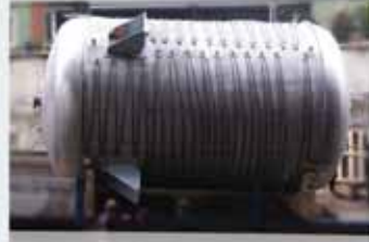
Gövde Borulu Eşanjör Shell & Tube Heat Exchangers