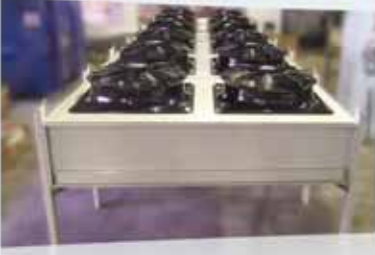
Hava Soğutmalı Kondenserler Air Cooled Condensers

KON THERM KONDENSER EVAPORATÖR SAN. VE TİC. A.Ş.